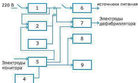
1 – преобразователь сетевой; 2 – зарядное устройство батареи; 3 – встроенная батарея; 4 – панель управления; 5 – устройство управления дефибрилятором; 6 – преобразователь DC-DC; 7 – зарядное устройство накопительных конденсаторов и высоковольтный коммутатор; 8 – дисплей; 9 – регистратор

Преобразователь сетевой (ПС) (1) осуществляет прием напряжения сети 220 В и его преобразование в магистраль постоянного тока напряжением 17–18 В. Выходное напряжение ПС и встроенной батареи (3) объединяется на пассивной диодной сборке и подается как силовое питание на зарядное устройство накопительных конденсаторов (7), зарядное устройство батареи (2) и через переключатель ДКИ – на преобразователь напряжения типа DC-DC для формирования сети напряжений питания всех узлов дефибрилятора.