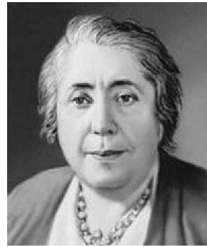
Рис. 6. Лина Соломоновна Штерн (1878-1968) [25]