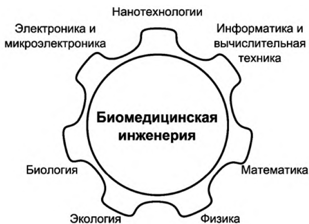
Рис. 1. Междисциплинарная образовательная программа кафедры БМС Национального исследовательского университета «МИЭТ»

Кафедра биомедицинских систем (БМС) Национального исследовательского университета «МИЭТ» создана в 1999 году на базе кафедры теоретической и экспериментальной физики, где в 1993 году первые 25 студентов начали обучение по специальности «Биотехнические и медицинские аппараты и системы». В настоящее время кафедра перешла на двухуровневую подготовку студентов: бакалавриат (4 года) по инициативному профилю «Биомедицинская электроника» и магистратура (2 года) по программе «Биомедицинская электронная техника».