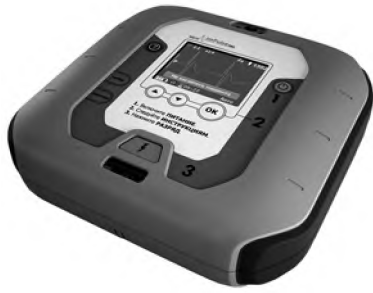
Рис. 2. Внешний вид автоматического дефибриллятора «imPulse PRO»