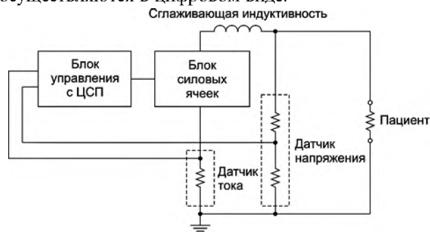
Рис. 2. Функциональная схема модуля формирования импульса Гурвича-Венина с использованием цифрового сигнального процессора (ЦСП)

управления, содержащий ЦСП, по заданному алгоритму управляет электронными ключами силовых ячеек. В отличие от предшествующих технологий все операции по управлению формированием импульса осуществляются в цифровом виде.