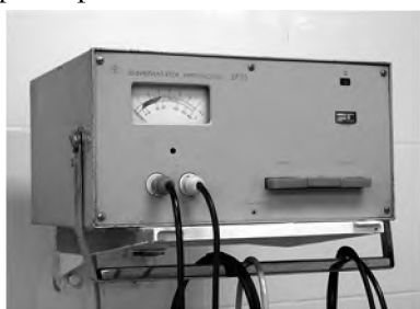
Рис. 1. Дефибриллятор ДИ-03

лирующего разряда у больных с высоким сопротивлением грудной клетки. В связи с этим современное поколение наружных дефибрилляторов регулирует величину энергии с помощью измерения сопротивления (импеданса) грудной клетки до нанесения разряда. Данная методика получила название «компенсация импеданса» (impedance compensation). При использовании этого способа энергия разряда подбирается автоматически, по измеренному импедансу, за счет изменения длительности импульса, амплитуды тока при фиксированной длительности и/или формы импульса. В настоящее время в мировой практике используются дефибрилляторы с различными формами импульса и способами компенсации импеданса. Существует два различных способа компенсации импеданса грудной клетки: первый основан на изменении длительности импульса, второй – на изменении тока при постоянной длительности импульса [9]. Оригинальные дефибрилляторы с импульсом Гурвича-Венина обеспечивают стабилизацию длительности импульса в реальном диапазоне импеданса грудной клетки за счет содержащегося в них разрядного LC-контура [10]. Таким образом, можно заключить, что в данных дефибрилляторах импеданс грудной клетки компенсируется за счет изменения амплитуды тока при фиксированной длительности импульса.