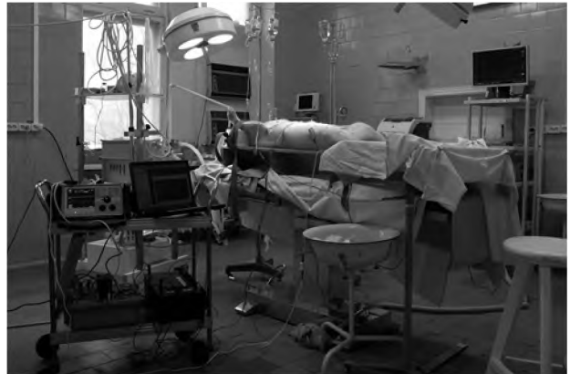
Рис. 4. Общий вид автоматизированного комплекса для экспериментальных исследований на животных

бравали. Верхний край правого электрода располагали примерно во 2-м межреберье (площадь токопроводящей поверхности около 50 см 2 ); центр левого – в области верхушки сердца (площадь токопроводящей поверхности около 100 см 2 ).