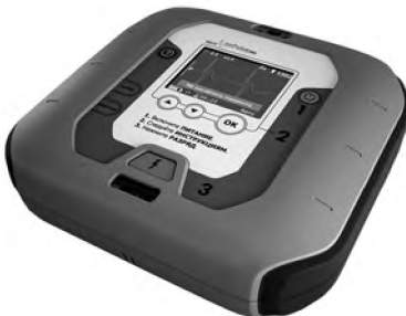
Рис. 6. Автоматический наружный дефибриллятор «imPulse PRO» для профессиональных применений (с цветным графическим дисплеем, полуавтоматическим, ручными синхронным и асинхронным режимами и режимом монитора)