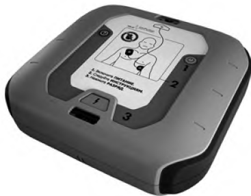
Рис. 5. Автоматический наружный дефибриллятор «imPulse» для публичных применений

Цифровой сигнальный процессор, используемый в данном исследовании, применим в приложениях формирования мощных импульсов заданной формы с использованием обратной связи по току и напряжению на нагрузке. Данная технология реализована в автоматических наружных дефибрилляторах «imPulse» (рис. 5) и «imPulse PRO» (рис. 6), разработанных на кафедре биомедицинских систем Московского государственного института электронной техники.