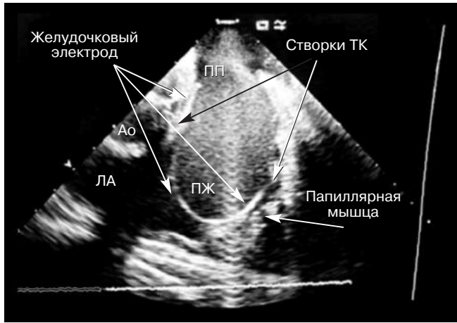
Рис. 1. Внутрисердечная ультразвуковая визуализация. Безопасное проведение желудочкового электрода в виде петли через трикуспидальный клапан.

Ао – аорта; ЛА – легочная артерия; ПП – правое предсердие; ПЖ – правый желудочек; ТК – трикуспидальный клапан