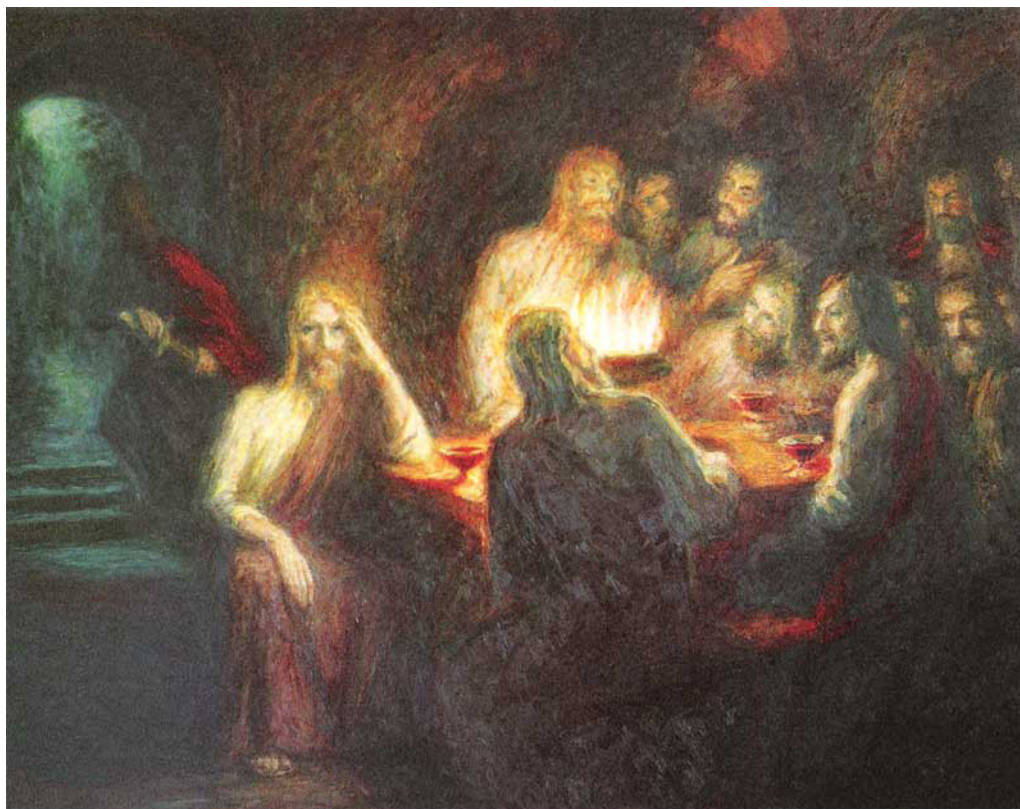
Abendmahl 1996 198,0 × 268,0 cm