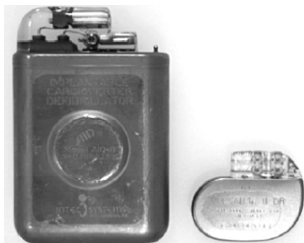
Рис. 5. Один из первых ИКД — AID-B (слева) рядом с современной моделью [53]

Многие люди, страдающие ХСН, имеют показания как для ресинхронизирующей терапии, так и для имплантации кардиовертера-дефибриллятора. Очевидно, что для таких пациентов совмещение в одном устройстве функций ИКД и бивентрикулярного стимулятора СРТ может быть весьма эффективным решением.