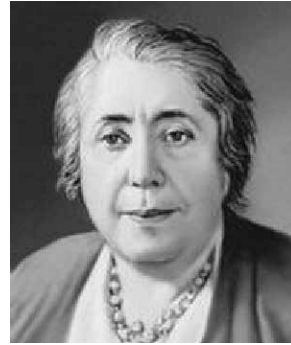
Рис. 6. Лина Соломоновна Штерн (1878-1968) [25]