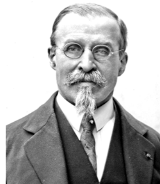
Рис. 4. Французский ученый Луи Эдуар Лапик

Указанная формула, по сравнению с формулой Ж. Вейса, хуже согласовывалась с результатами экспериментов Я.Л. Гюорвега, Ж. Вейса и Л. Лапика.