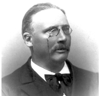
Рис. 1. Голландский ученый Ян Лендерт Гоорвег

Первым точное измерение воздействия электрического тока на возбудимую биологическую ткань выполнил голландский ученый Ян Лендерт Гоорвег (Jan Leendert Hoorweg, рис. 1 ). Результаты своих исследований он опубликовал в 1892 году в старейшем физиологическом журнале «Pflügers Archiv», который был основан в Германии в 1868 году немецким физиологом Эдуардом Фридрихом Вильгельмом Пфлюгером (Eduard Friedrich Wilhelm Pflüger) [1], [2].